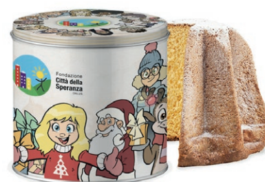
PANDORO IN ELEGANTE LATTA DECORATA