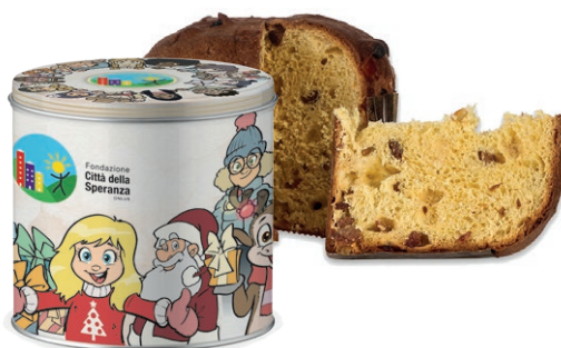
PANETTONE IN ELEGANTE LATTA DECORATA