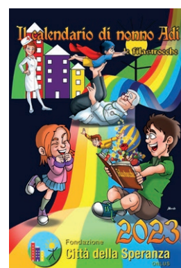
CALENDARIO DEI BAMBINI

*Pandoro/Panettone in confezione di cellophane